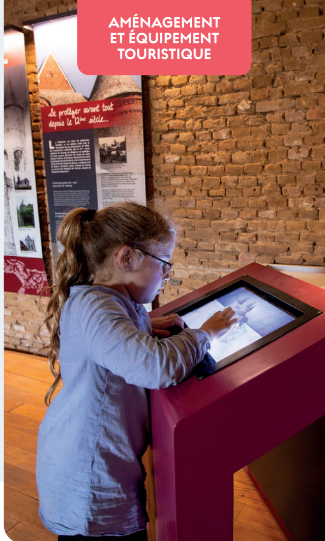
© OT de Thiérache - Loïc RIDOU - Église fortifiée de Parfondeval