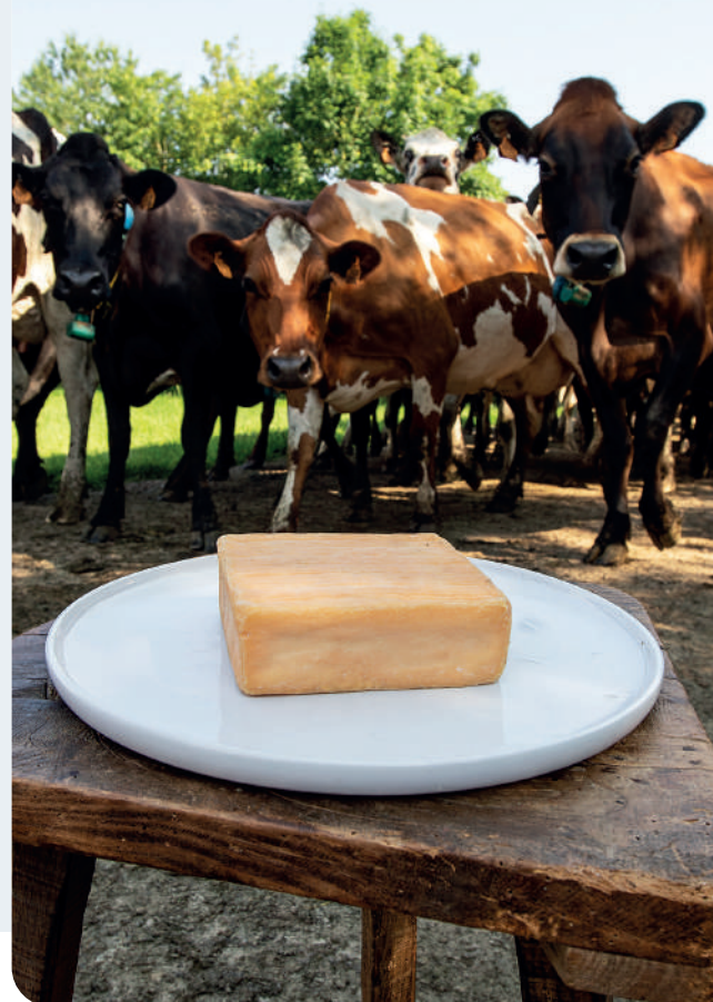
© Office de tourisme de Thiérache - Loïc RIDOU - Ferme Fontaine Orion

Le Plan Alimentaire Territorial du Pays de Thiérache, né en 2018, est un dispositif central pour aspirer à des modes de production et de consommation plus durables.