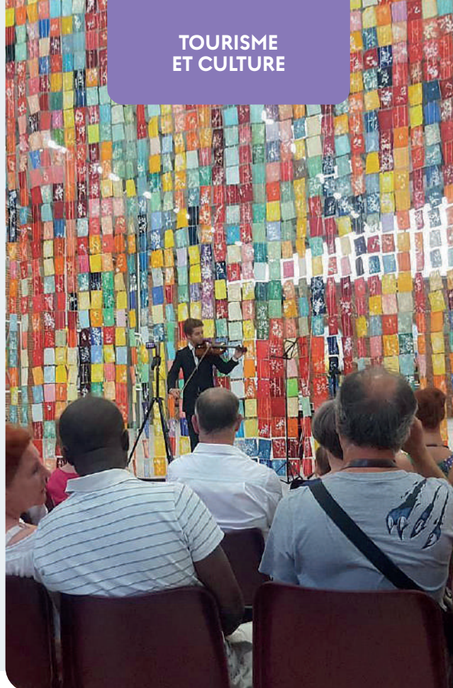
© Les Bohériales - Philharmonie des couleurs - Abbaye de Bohéries

Cependant, l'offre touristique nécessite d'être davantage coordonnée et animée afin de faire valoir le potentiel du territoire : déployer une culture de l'accueil ainsi qu'une animation territoriale diversifiée au service des touristes, excursionnistes mais aussi des habitants passe par la définition d'une stratégie ambitieuse et en cohérence avec les défis du territoire ainsi que par une mobilisation durable des professionnels du secteur.