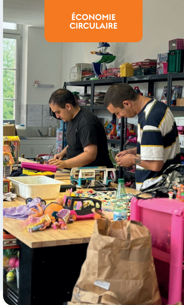
© PETR de Thiérache - Chantier d'insertion Recycl'jouets

Des enjeux forts apparaissent pour initier des dynamiques nouvelles et engager le territoire. Le contrat d'Objectifs Territorial, signé en 2021 avec l'ADEME, est un outil essentiel dans l'accompagnement des collectivités vers des pratiques plus vertueuses.